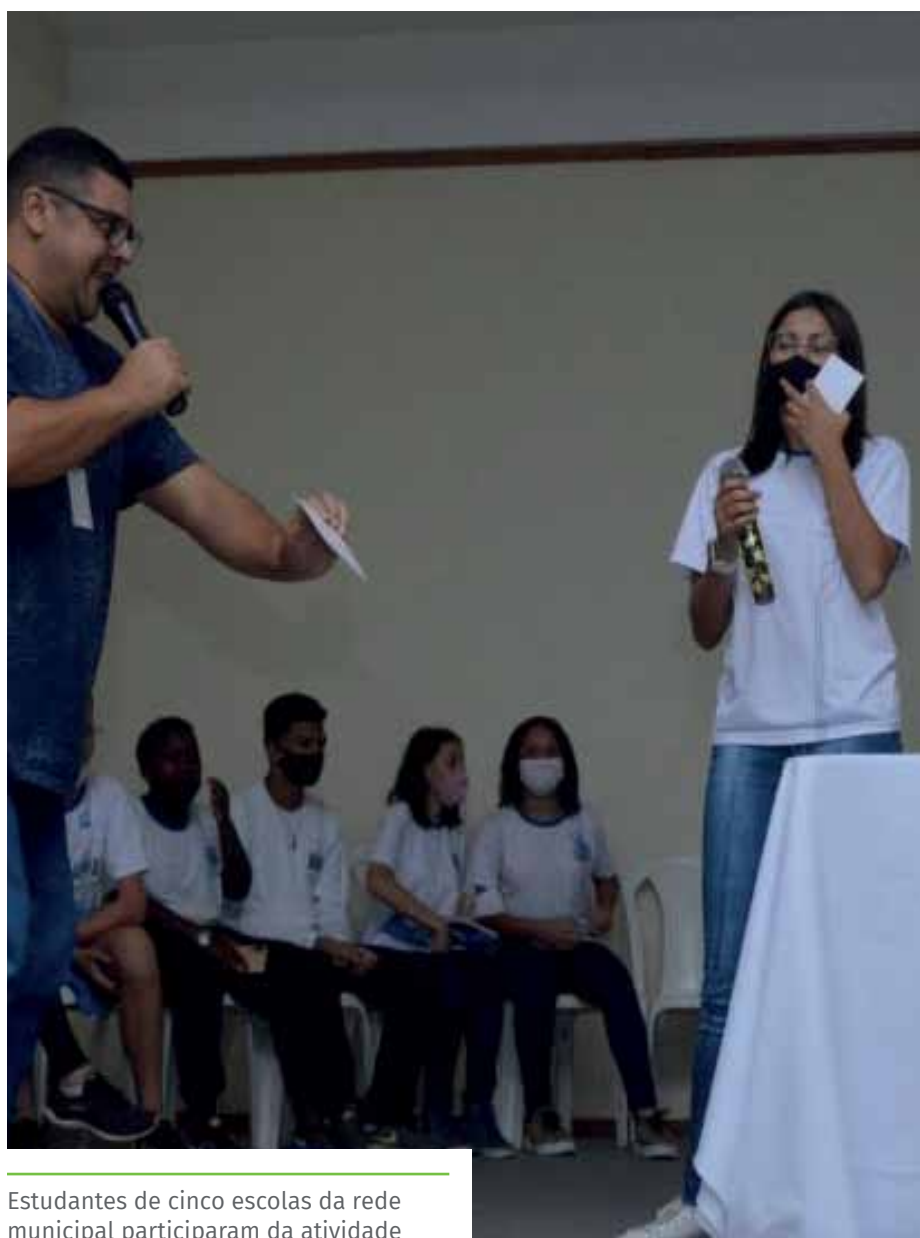
Estudantes de cinco escolas da rede municipal participaram da atividade

Além disso, a programação contou, também, com a realização do Miss Jovem Guarda 2022 e do concurso de fãs “Minha História com o Rei”.