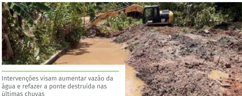
Intervenções visam aumentar vazão da água e refazer a ponte destruída nas últimas chuvas