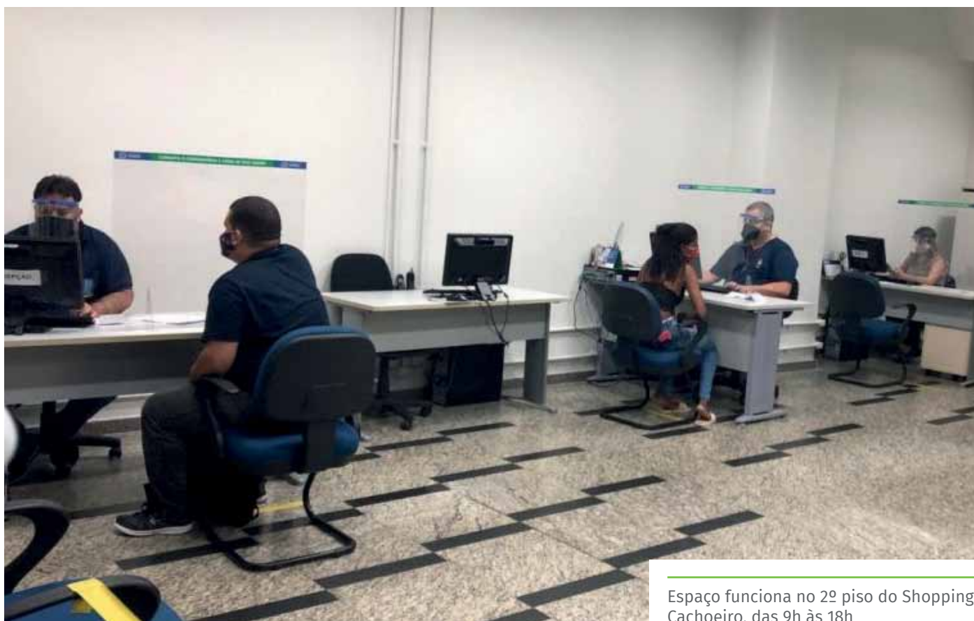
Espaço funciona no 2º piso do Shopping Cachoeiro, das 9h às 18h

A modalidade permite a contratação de até R$ 21 mil, com taxas que vão de 0,99% a 1,50% ao mês. O prazo para pagamento é de até 36 meses (o que inclui 180 dias de carência).