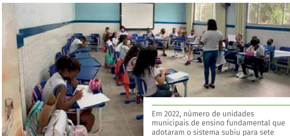
Em 2022, número de unidades municipais de ensino fundamental que adotaram o sistema subiu para sete