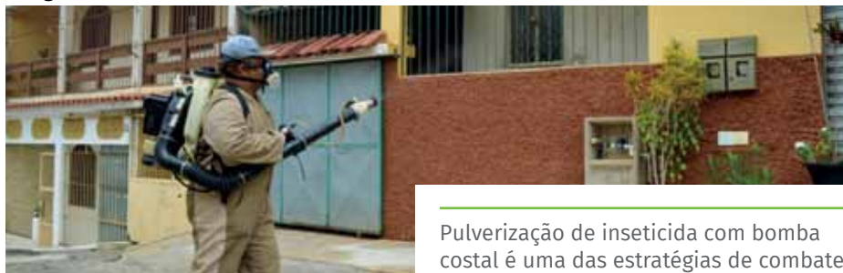
Pulverização de inseticida com bomba costal é uma das estratégias de combate

Também está sendo providenciada a aquisição de um óleo vegetal com inseticida específico para combater o Culex a partir de pulverização.