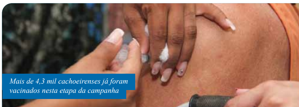
Mais de 4,3 mil cachoeirenses já foram vacinados nesta etapa da campanha

Inicialmente previsto para o dia 9 de maio, o Dia D da campanha não será mais realizado em Cachoeiro, para evitar a formação de aglomerações, uma medida preventiva relativa à transmissão de covid-19.