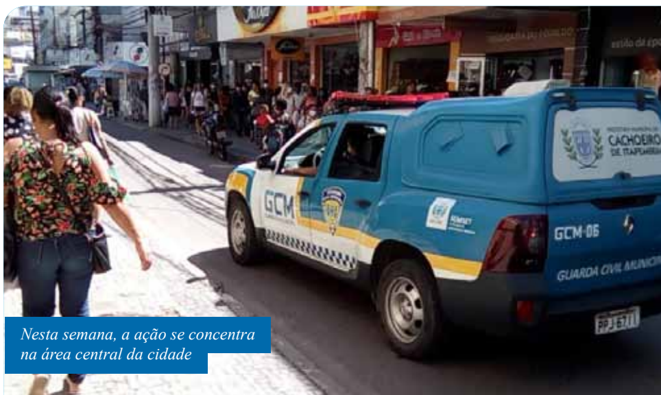
Nesta semana, a ação se concentra na área central da cidade

A GCM também está monitorando áreas do município em que têm sido registradas aglomerações relativas a atividades de lazer, nos fins de semana. É o caso de um loteamento no bairro Marbrasa, onde muitas pessoas