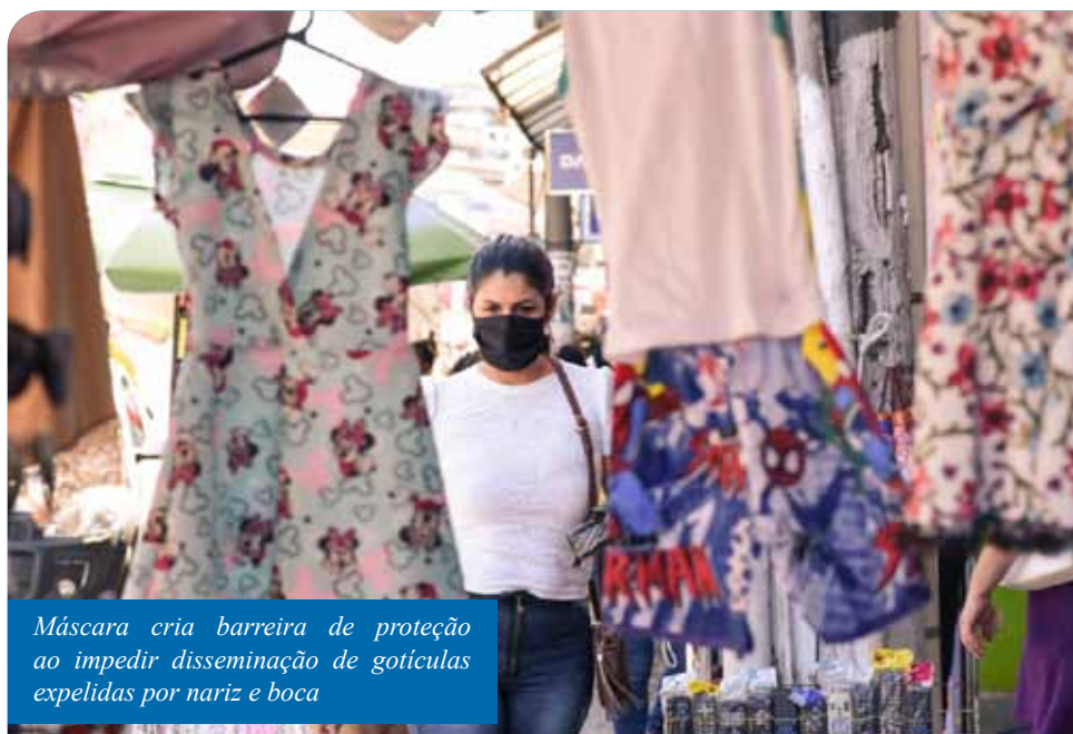
Máscara cria barreira de proteção ao impedir disseminação de gotículas expelidas por nariz e boca