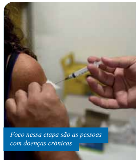
Foco nessa etapa são as pessoas com doenças crônicas

A terceira e última etapa começará no Dia D da campanha, em 9 de maio. Serão vacinados, nesta fase, professores; crianças entre 6 meses de vida e menores de 6 anos de idade; gestantes; puérperas (até 45 dias após o parto); indígenas; adultos de 55 a 59 anos de